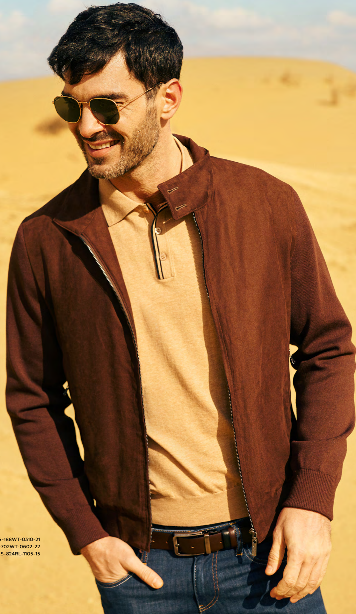
БОМБЕР 2S-188WT-0310-21 ПОЛО 2S-702WT-0602-22 ДЖИНСЫ 2S-824RL-1105-15