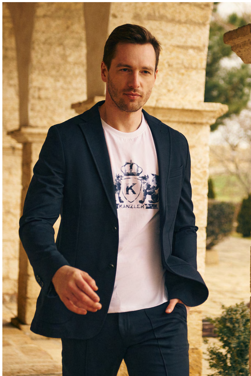
ПИДЖАК 2S-218SL-11143-15 ФУТБОЛКА 2S-785WT-0603-02/1