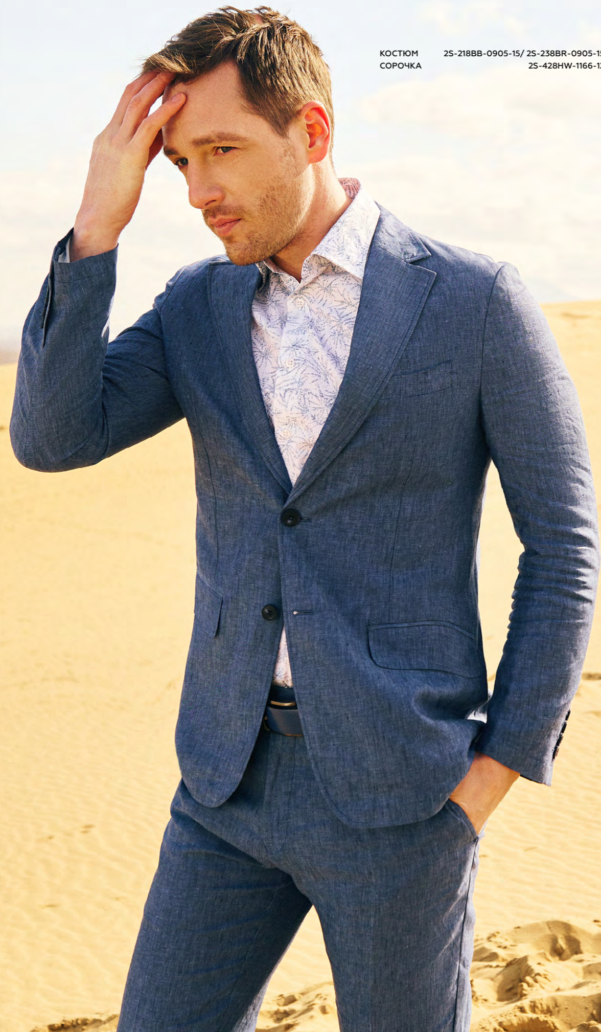
КОСТЮМ 2S-218BB-0905-15/ 2S-238BR-0905-15 СОРОЧКА 2S-428HW-1166-12