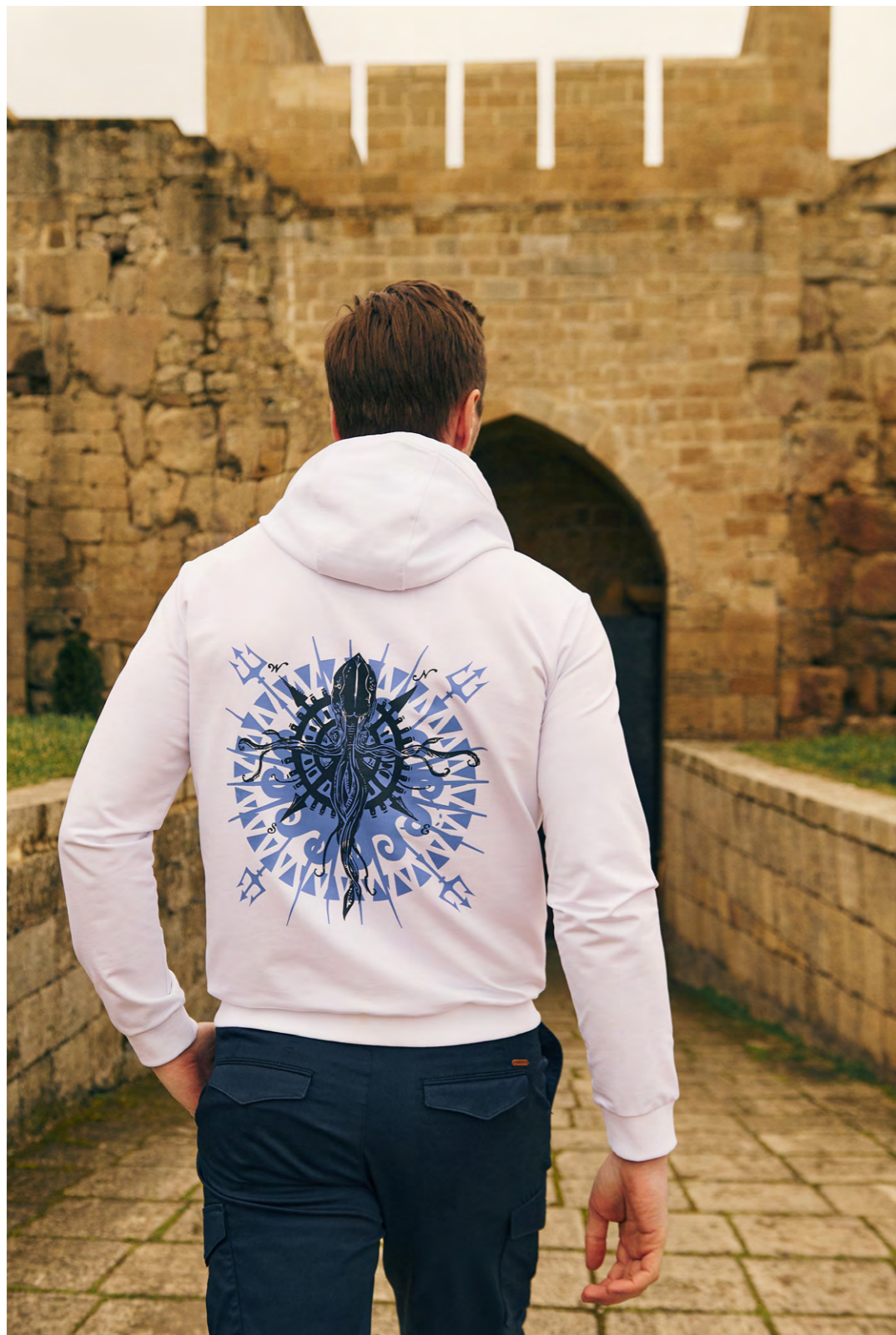
ТОЛСТОВКА 2S-313WT-0607-02 БРЮКИ 2S-508RL-11119-15