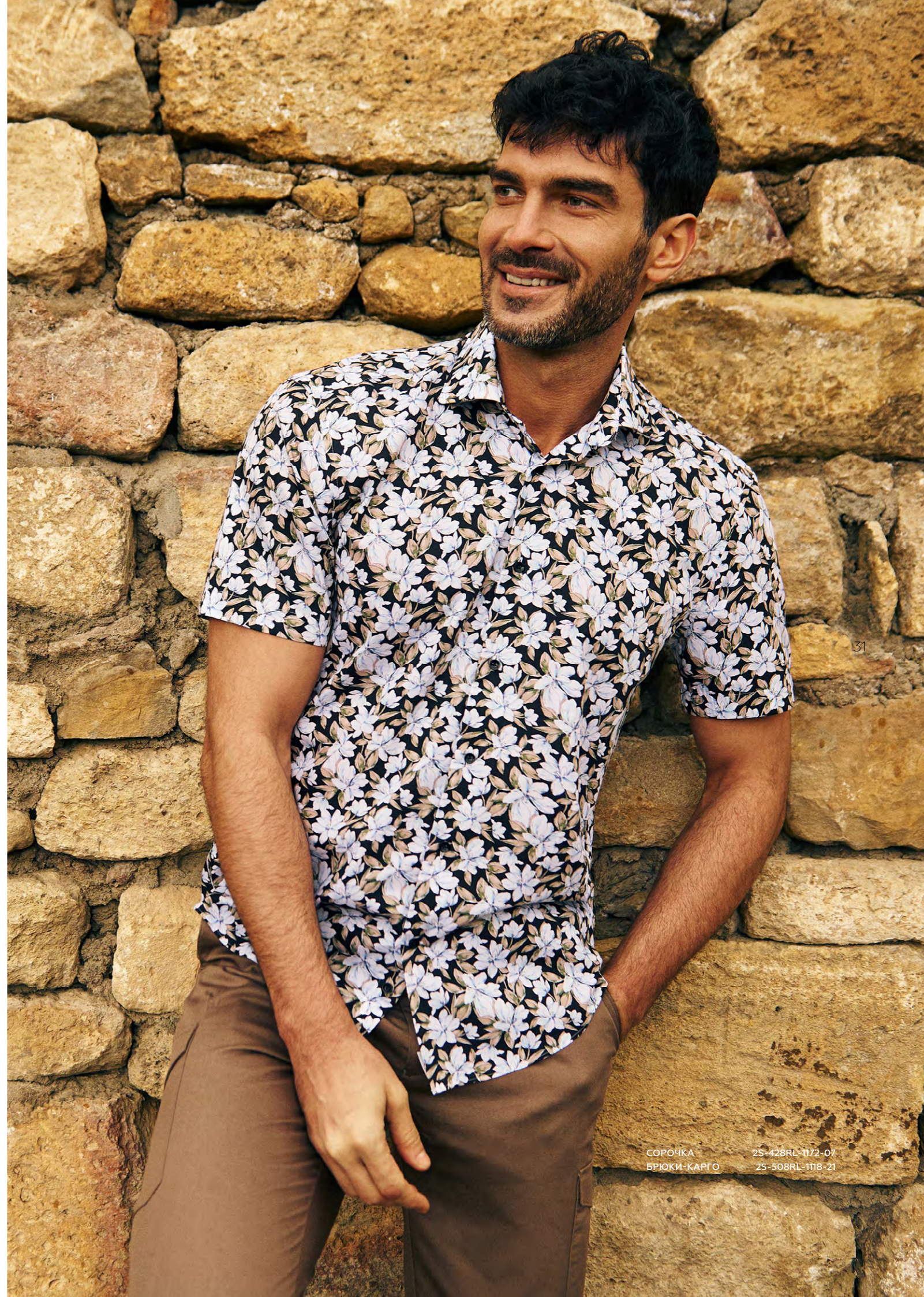
СОРОЧКА 2S-428RL-1172-07 БРЮКИ-КАРГО 2S-508RL-1118-21