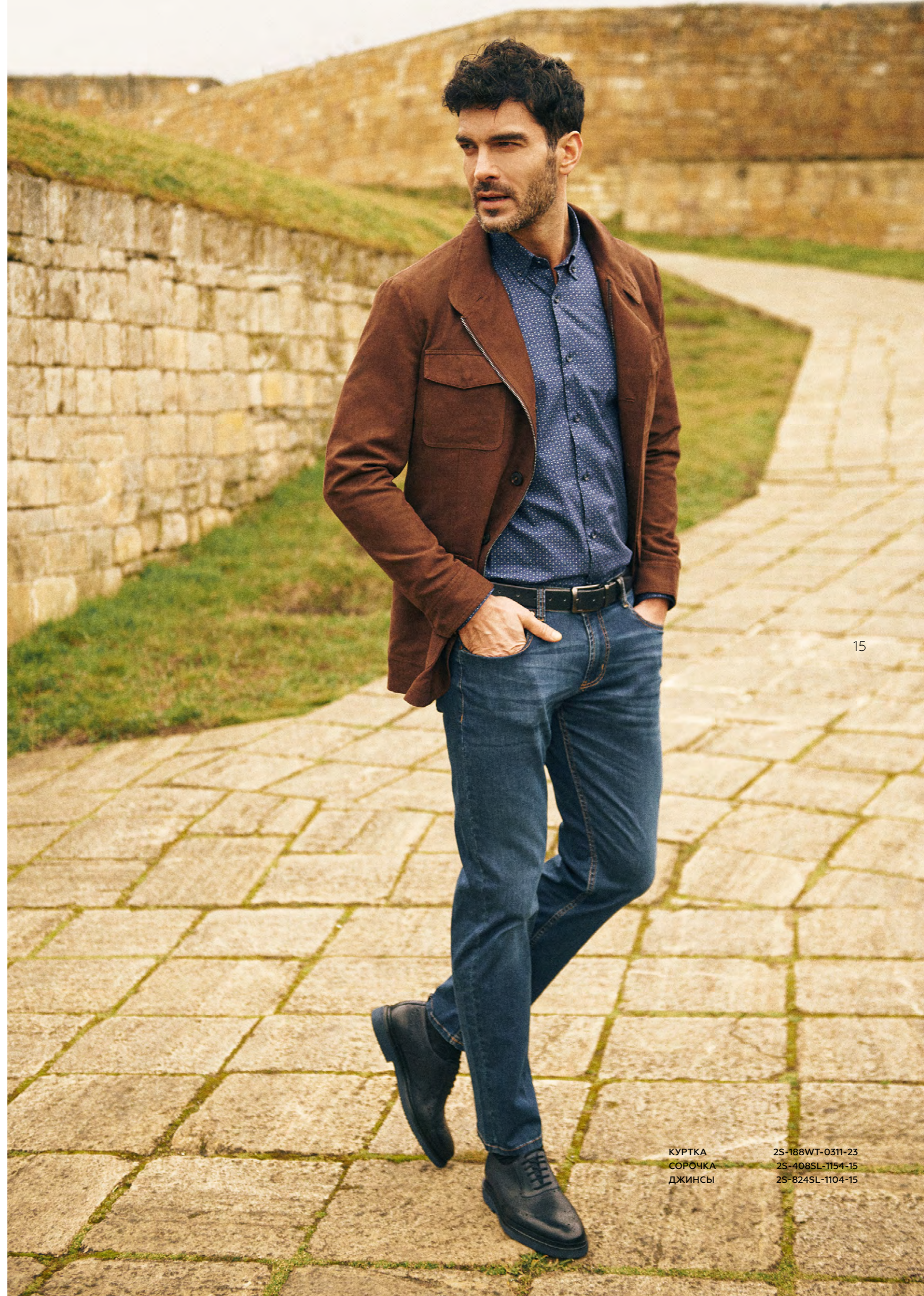
КУРТКА СОРОЧКА ДЖИНСЫ

2S-188WT-0311-23 2S-408SL-1154-15 2S-824SL-1104-15