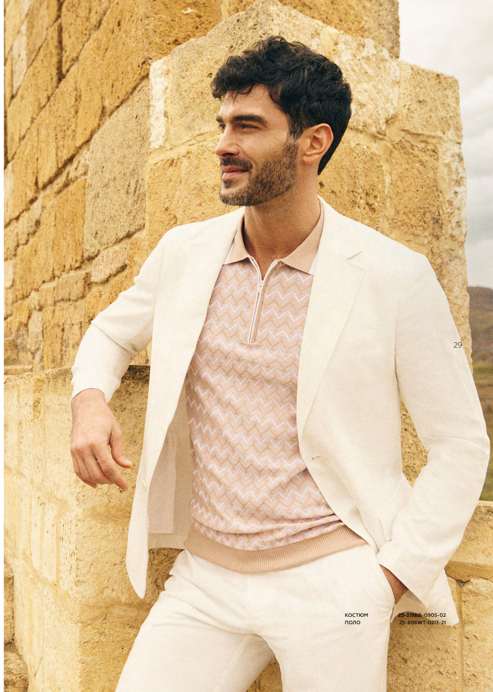
КОСТЮМ 25-218BB-0905-02 ПОЛО 25-606WT-0213-21