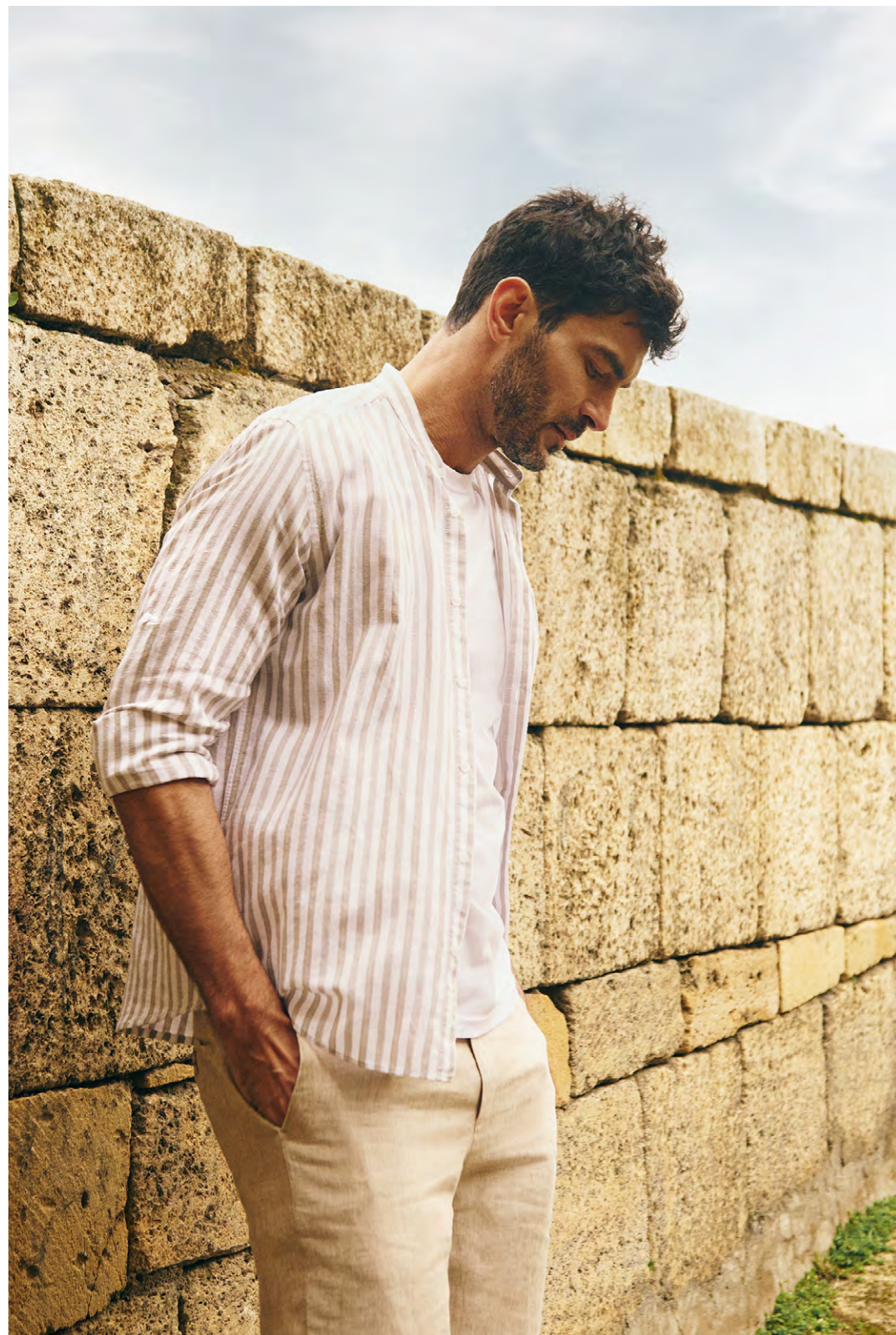
СОРОЧКА 25-408CS-1152-21 БРЮКИ 25-508CF-11136-21