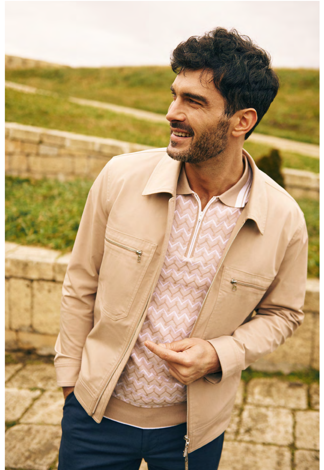
КУРТКА 2S-166WT-0316-21 ПОЛО 2S-606WT-0213-21 БРЮКИ 2S-503RL-11113-15