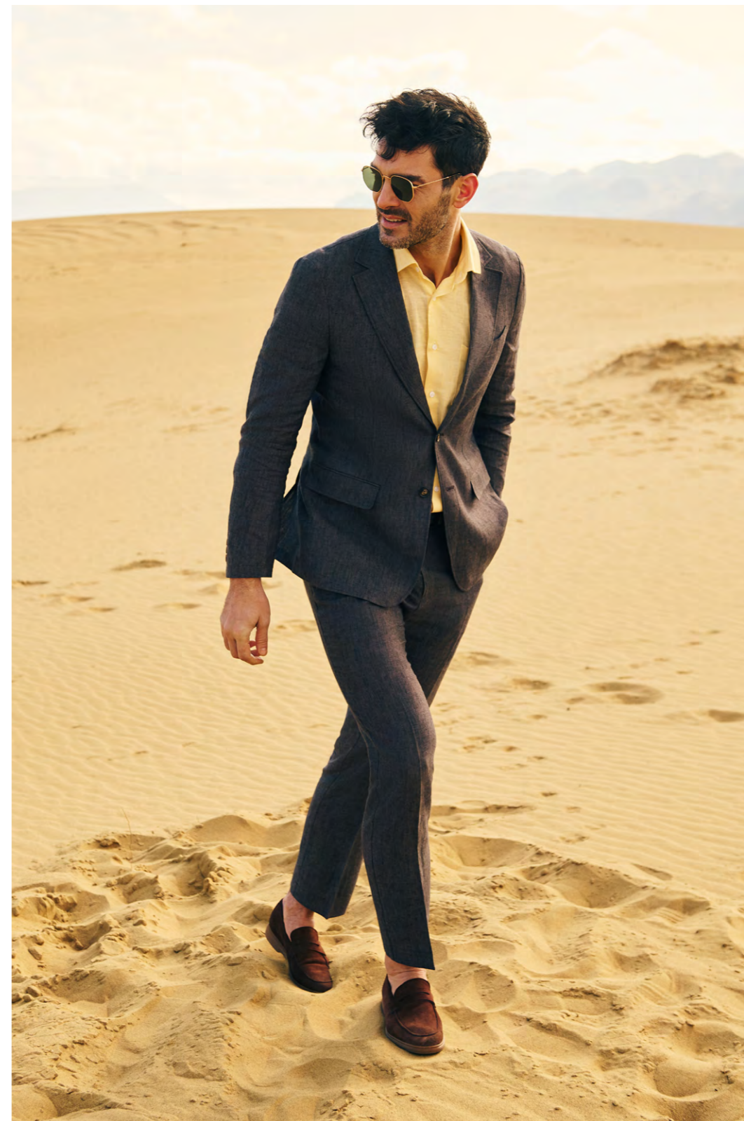
КОСТЮМ 2S-218BB-0905-23/2S-238BR-0905-23 СОРОЧКА 2S-423RL-1145-71