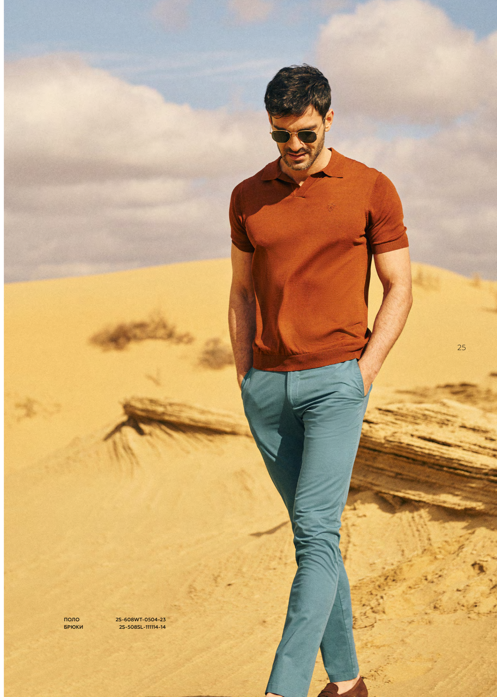
ПОЛО 2S-608WT-0504-23 БРЮКИ 2S-508SL-11114-14