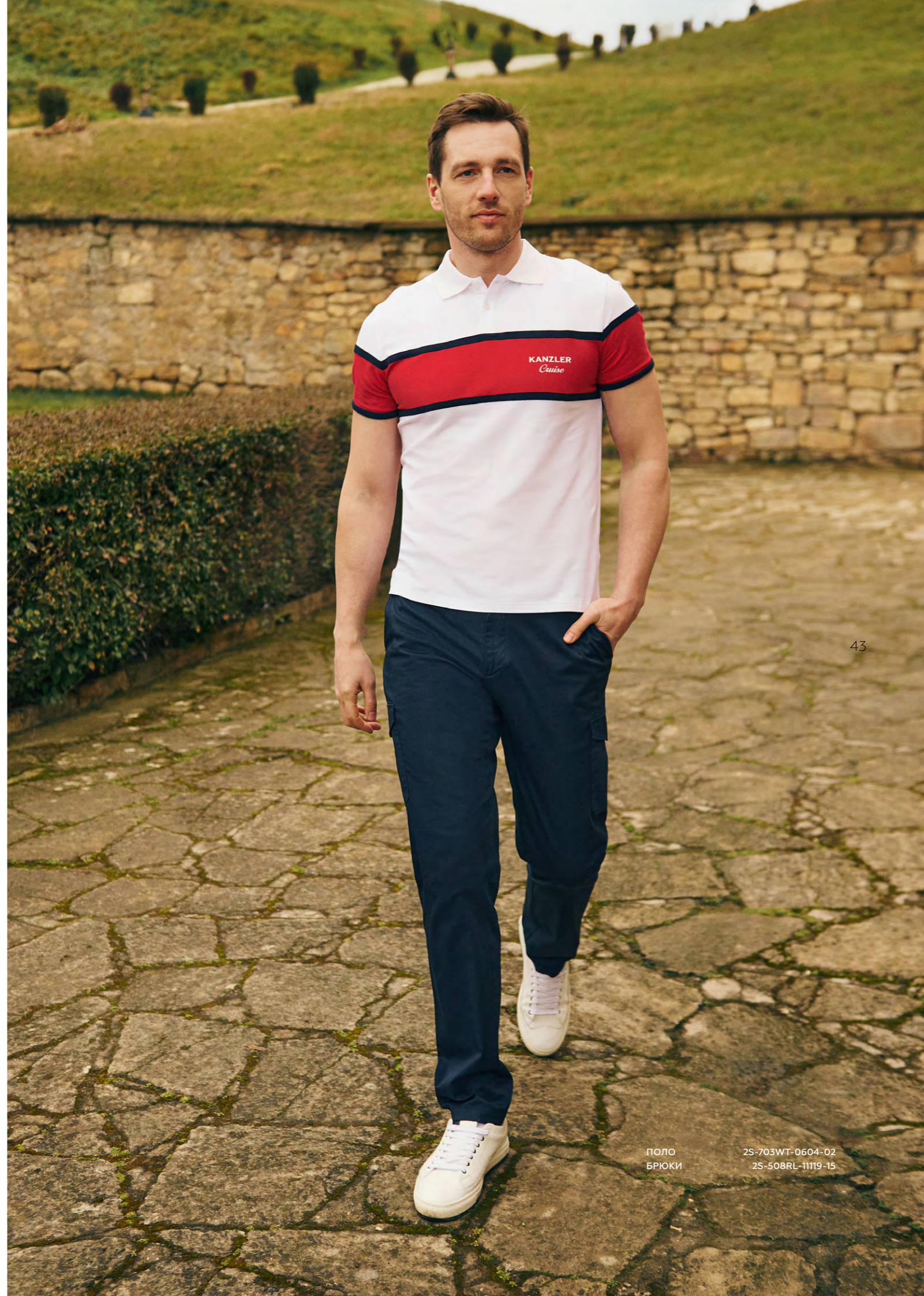
ПОЛО 2S-703WT-0604-02 БРЮКИ 2S-508RL-11119-15